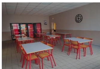
salle Jules FERRY